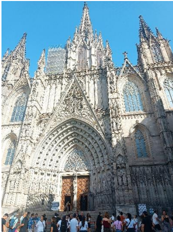
3. kép Gótikus negyed-Szent kereszt és Szent Eulália székesegyház

képzés után megnéztem a tengerpartot, az ismert Sagrada Familliat (Szent - család templom), Güell parkot, La Rambla a város legnevezetesebb utcáját és az innen nyíló világhírű piacát a La Boqueriat.