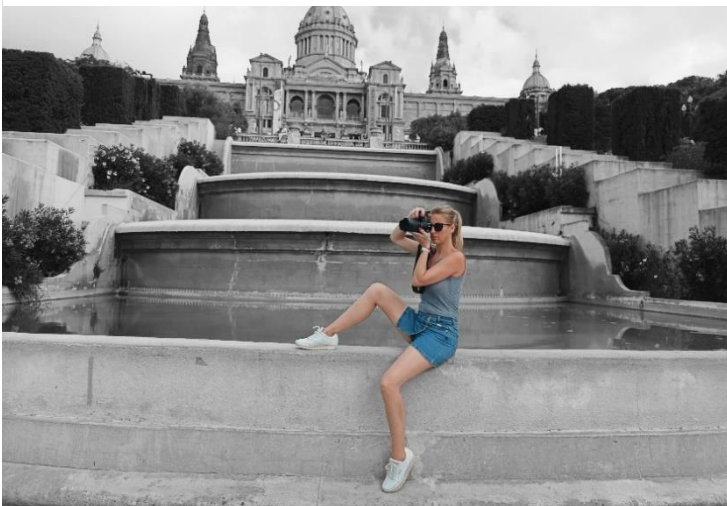
7. Mondjuic hegy lábánál- Katalán Nemzeti Szépművészeti Múzeumnak