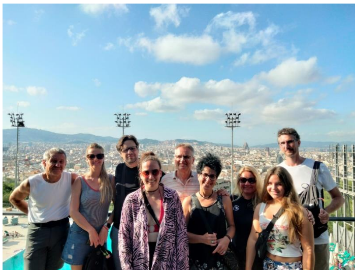
5. kép Montjuic hegy

lehetőség, a más egyetemekről érkezőkkel ismerkedni és a nyelvet gyakorolni. A kirándulás alatt megnéztük a gótikus negyeden kívül, a Vízesség szökőkutat (Cascada), Barcelona diadalívét, mely pálmákkal körbevett sétányon található és a Szent Kereszt és Szent Eulália székesegyházat.