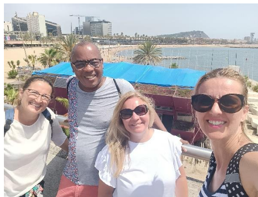
2. kép Óra a tengerparton