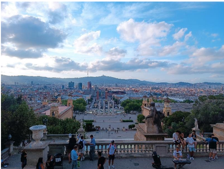
6. kép Mondjuic hegyről a kilátás