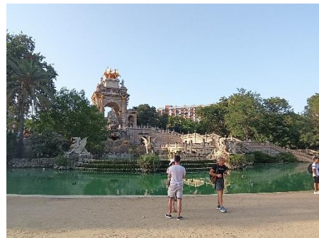
4. kép Vízesség szökőkút

A hétfői napon Barcelona (1. nap) gótikus negyedet néztük meg a héten induló képzésen résztvevőkkel közösen, ami 2,5-3 órás városnézést jelentett. Találkozási pont a Hard Rock Café volt, ami a város legnevezetesebb utcáján a La Ramblan található. Olyan helyekre vittek el minket, amiket valószínű ebben a rövid ott töltött időben biztos nem lett volna idő megnézni. Itt volt