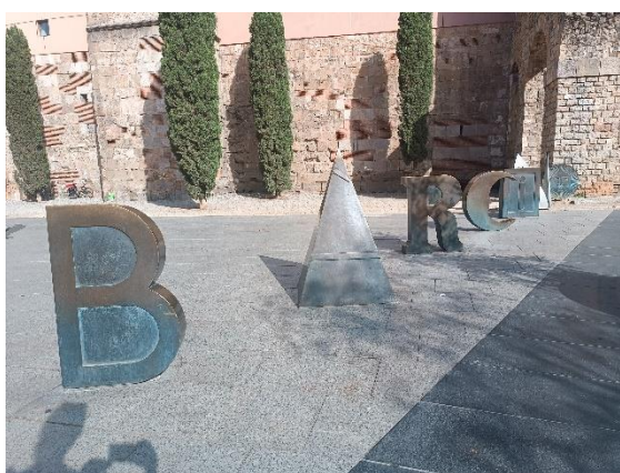
1. kép Óváros

Spanyolországban-Barcelonában vettem részt 1 hetes alapfokú angol képzésen, amit egy tengerparti iskolában tartottak. A csoport létszáma 3 fő volt a csoporttársaim Németországból és Magyarországról a szolnoki Nemzeti Közszerződési Egyetemről érkeztek. Az órákat a délelőtti folyamán tanteremben szituációs feladatokkal, feladatlapok megoldásával és csoportos